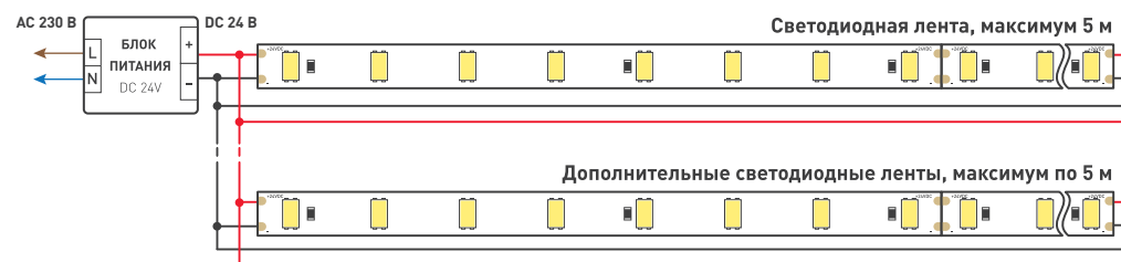
Схема 1. Подключение нескольких светодиодных лент с двух сторон