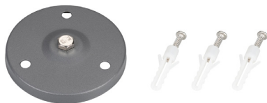
Рис. 2. Основание для установки на поверхность (ALT-BASE-R75, арт. 024890)