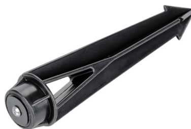
Рис. 3. Основание для установки в грунт (ALT-SPIKE-175, арт. 024888)