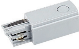
Коннектор питания LGD-4TR-24B-L-WH

Концевой коннектор для подачи питания на трек