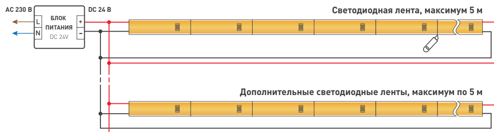
Схема 1. Подключение нескольких светодиодных лент с двух сторон